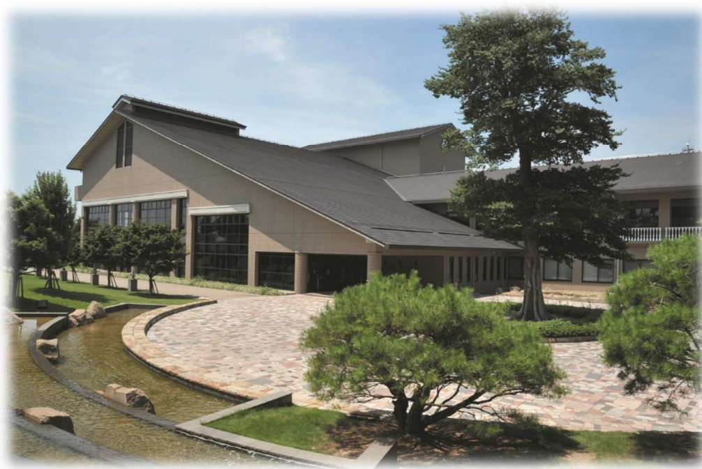
あま市美和文化会館