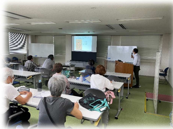
シルバーカレッジ（あま市史跡巡り）