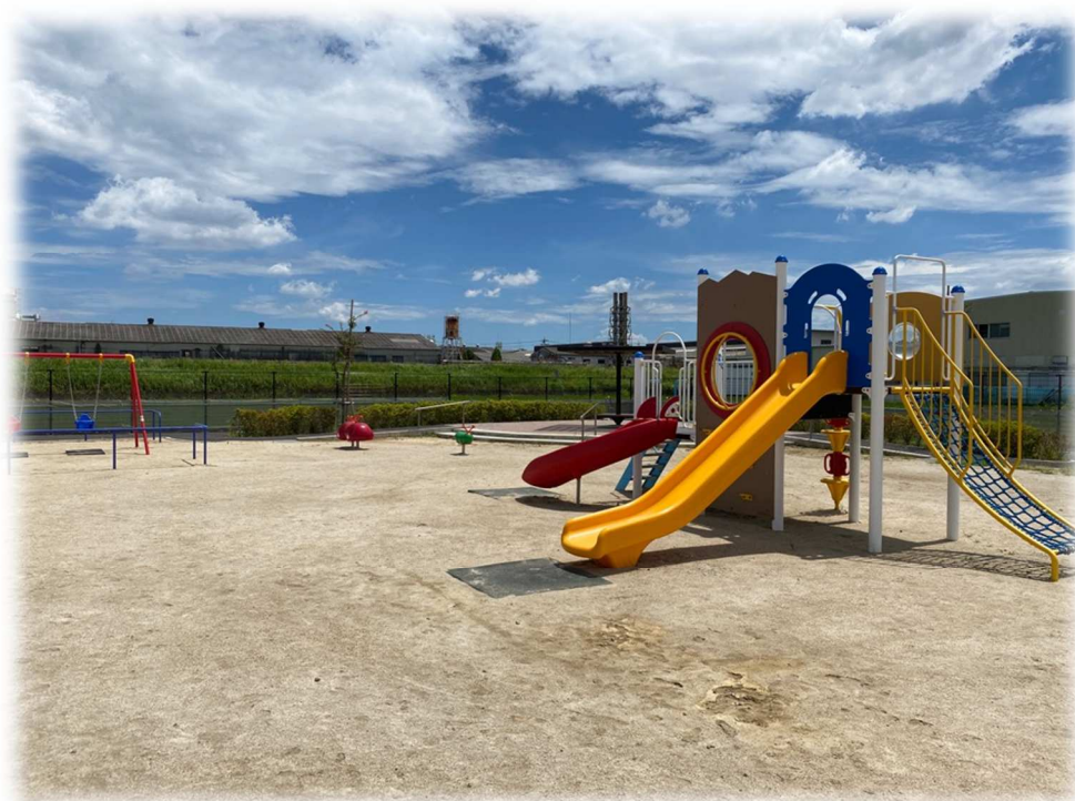
都市公園 スマイルパーク