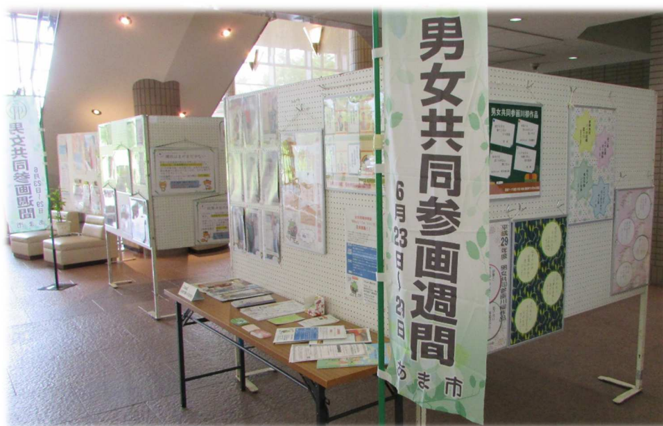
男女共同参画週間パネル展