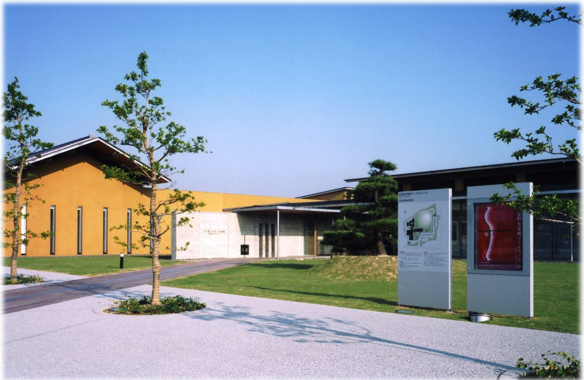
あま市七宝焼アートヴィレッジ