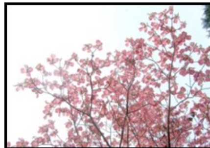
あま市の木 はなみずき