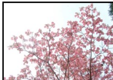
あま市の木 はなみずき