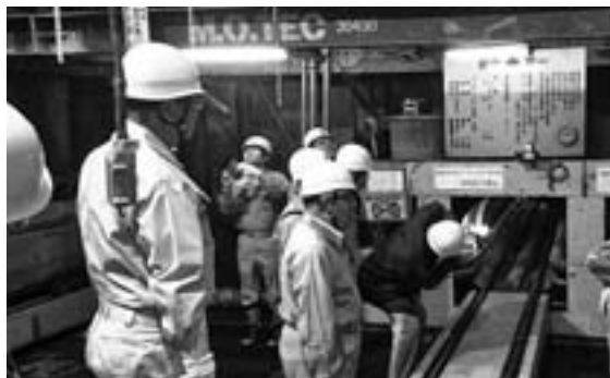
日光川下流1号幹線(下水道工事現場)

○視察日 平成29年3月3日(金) ○視察先 市内下水道工事現場(花長工区) 普段入ることができない地下10メートルの所で担当者から説明を受け、現場を目の当たりにし大変意義深いものとなりました。