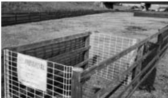
庄内川河川敷公園(ドッグラン)

また、ドッグランは4月頃から全面オープンの予定で、中・小型犬用、大型犬用、競技犬用があり、駐車スペースや簡易トイレなどを確認しました。