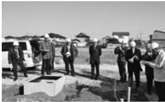
七宝三角・柏田土地区画整理事業(工事現場)