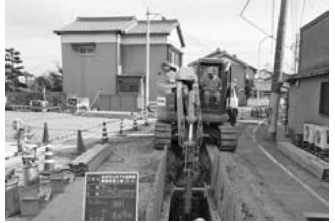
下水道工事の様子