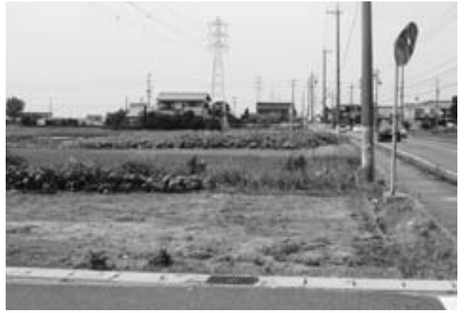
新庁舎建設候補地(沖之島深坪地区)