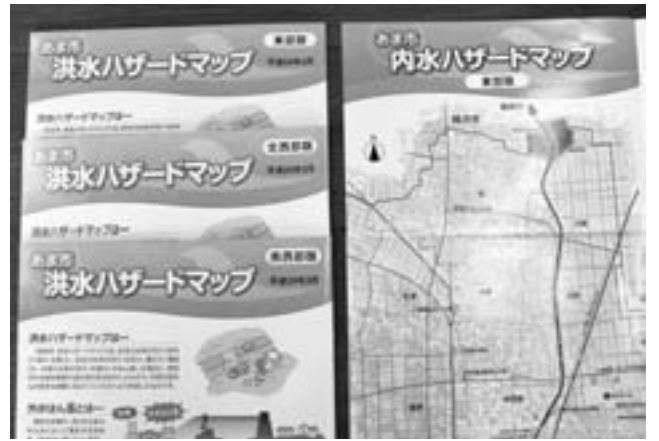
あま市洪水・内水ハザードマップ