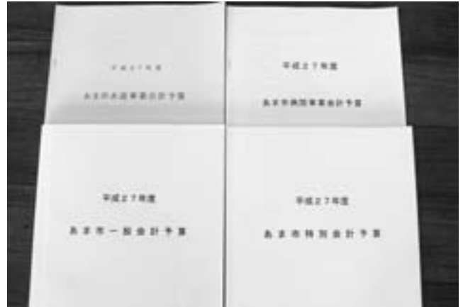
平成 27 年度 あま市予算書