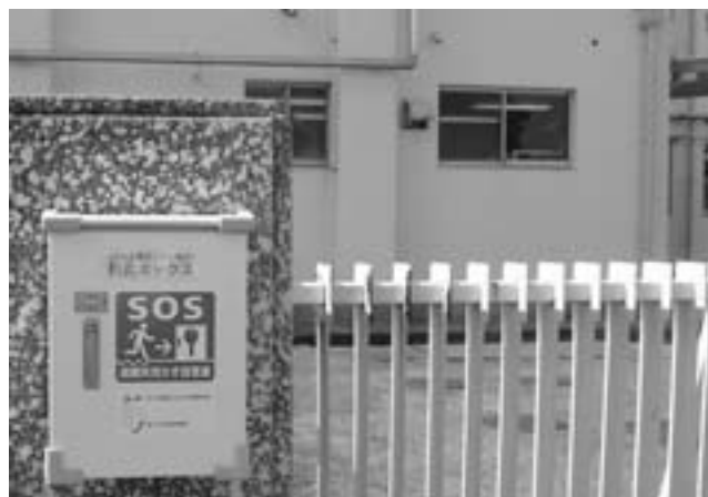
防災ボックス(避難所用鍵保管庫)