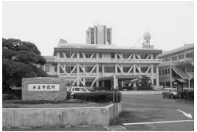
あま市役所本庁舎

Continuing Care Retirement Community の略。 高齢者が健康で自立して生活できるうちに入居し、 必要に応じて介護や医療のサービスを受けながら、人 生最期の時までを過ごす高齢者のための生活共同体。 2014年12月に政府が決定した「まち・ひと・しごと 創生総合戦略」では、日本版CCRCの創設を検討 することが盛り込まれた。