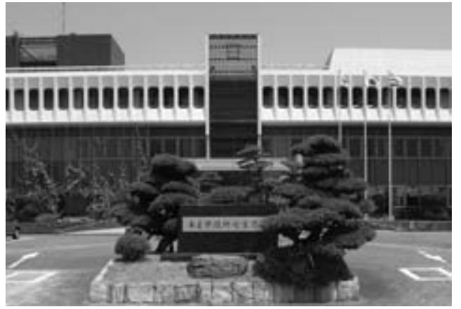
あま市役所七宝庁舎