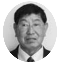
岩本 一三 議員

問 合併後の区長の立場、身分はどうなっているか。 総務部長 平成23年度より、市からの委嘱任命はしていない。地域のリーダーとして多面から支援している。