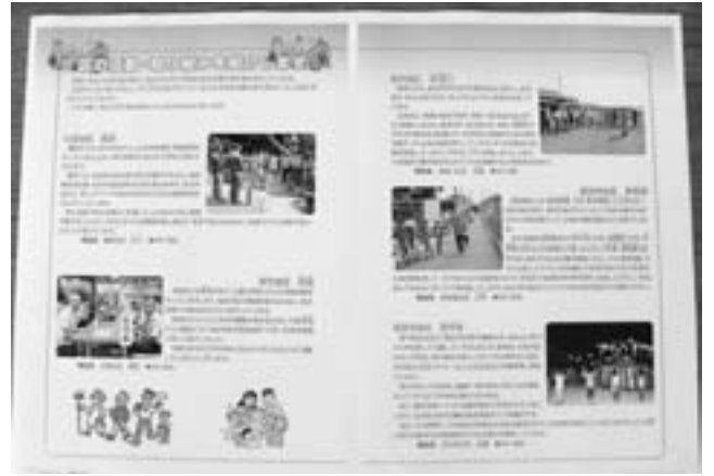
区の活動・取り組みの紹介(市広報掲載記事より)