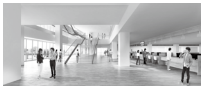
広場に面して明るいあまらウンジ・市民活動スペース