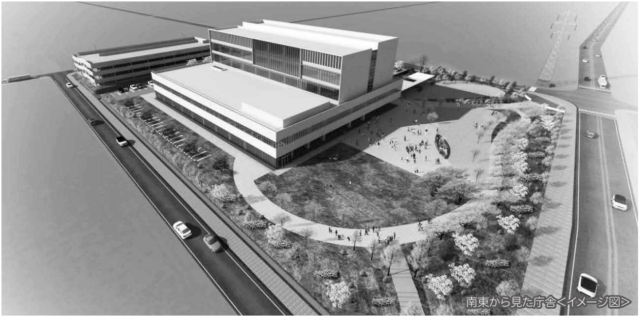
南東から見た庁舎<イメージ図>

市では、平成34年度の開庁を目標に、現在新庁舎整備事業を進めています。このたび、平成28年度から2か年かけて、市民ミーティングや基本設計委員会、パブリックコメントなど、市民の皆様にご参加いただきながら「市民参加型」による庁舎づくりを進め、基本設計をとりまとめましたので、その概要についてお知らせします。