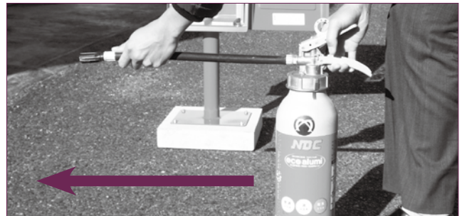
③ 消火器のホース先端を火元へ向け、消火器のレバーを強く握ります。