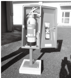
① 消火器ボックスから消火器を取り出す。