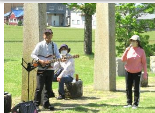
6期生 5/9 外で歌おう