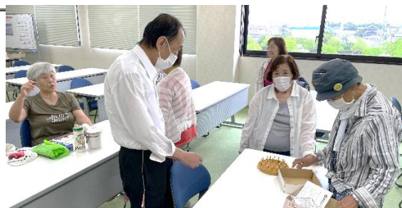
2期生 6/30 手作りゲームで脳トレ

6期生はあま市の「出前授業」を活用して、カレッジで学び足りなかったことにすすんで挑戦しています。2期生は息の長い活動を続けています。ゆったりのんびり「きょうよう」を作りましょう。