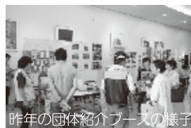
昨年の団体紹介ブースの様子

問合先 企画政策課パートナーシップ推進室 ☎444・1712 安全安心課 ☎444・0862