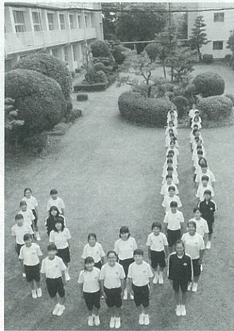
甚目寺中学校 吹奏楽部

今年は、学校行事やコンクールだけでなく、地域の演奏会に出演させていただく機会が増え、ますますはりきっています。一つ一つの機会を大切に、そして皆様楽しんでいただける演奏をしたいと思えます。