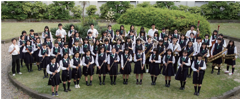
五条高等学校 吹奏楽部