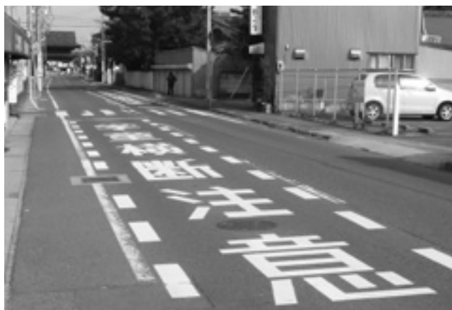
学童横断注意の路面標示

通学路交通安全プログラムに基づき、甚目寺地区、七宝地区において合同点検を実施した。平成29年度には美和地区で実施予定。危険箇所の実情に応じ、学童注意の路面標示や用水路へのフェンスの設置など順次対策を進めている。