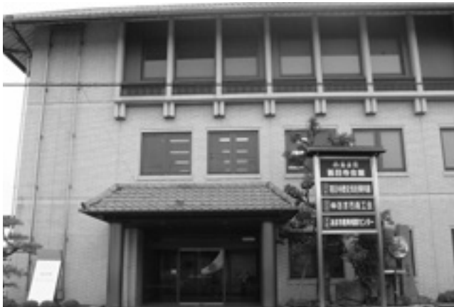
避難所となる甚目寺会館

ていきたい。 問 あま市は4人に1人が65歳以上の高齢者である。市長が掲げる「あま」の住み続けたい「あま」の実現に向けてどのように考えるか。 市長 昨今の大規模災害の発生で、市民の危機管理や危機意識が大変高まっている。その中で、あま市は今何ができるか考えなければいけない。見直しを含め、バリアフリー化未対応の部分に関