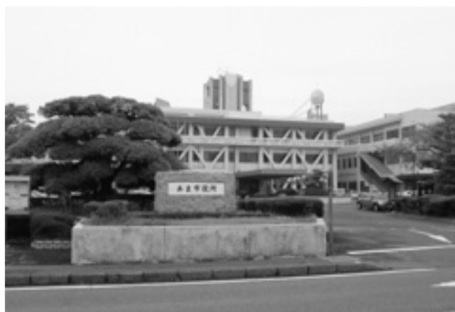
あま市役所本庁舎