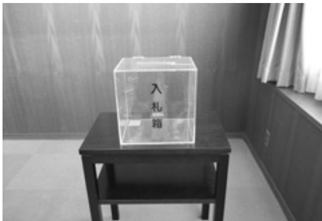
あま市の入札で使用されている入札箱