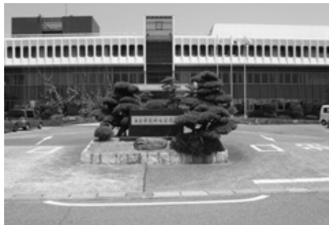
あま市役所七宝庁舎