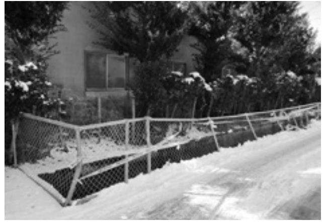
ふたがされていない公共用水路