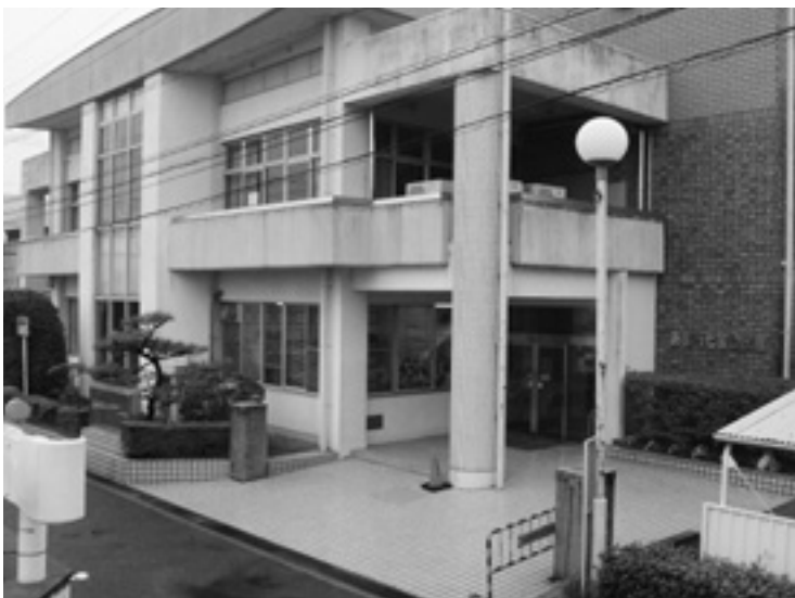
業務移転予定の七宝公民館