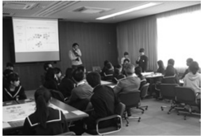
市民ミーティングの様子