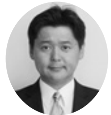
山本 雄一 議員