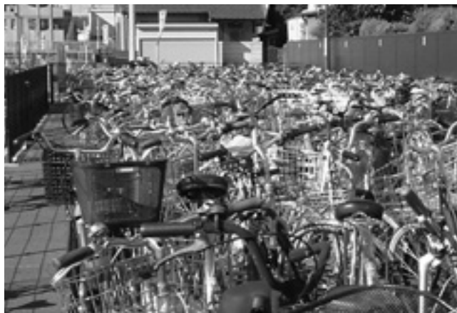
木田駅南側駐輪場