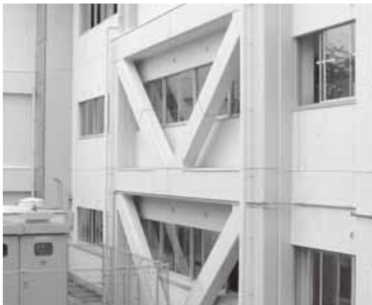
耐震化対策の施された校舎