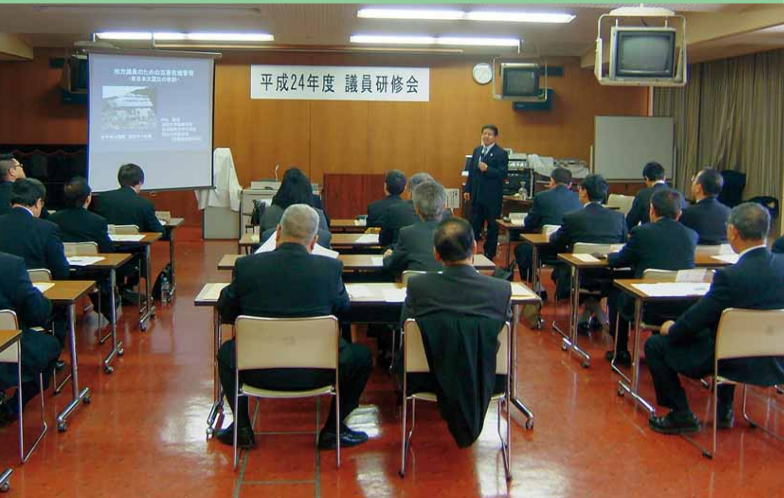
議員研修会 (2月12日 甚目寺公民館にて)