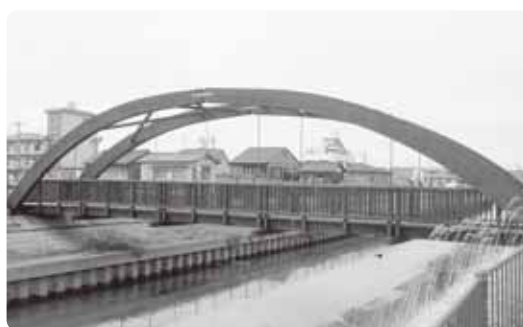
ガーデンブリッジ