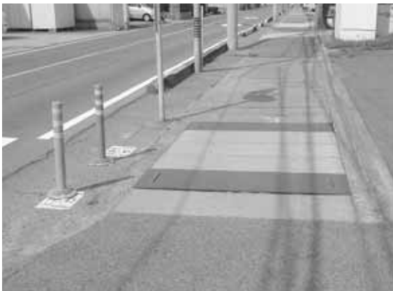
段差が多く、歩きづらい歩道

名での違反状態の是正通知による指導も含め、今後も安全な通行確保に努める。 問 名鉄津島線北側（甚目寺小学校北側付近）で犬のふんの放置がひどく、衛生環境が非常に悪化している。対策は。 市民生活部長 市広報への定期的な掲載や、狂犬病予防注射の実施会場で啓発活動を含め、飼い主のマナー、モラル向上のため一層の啓発をして