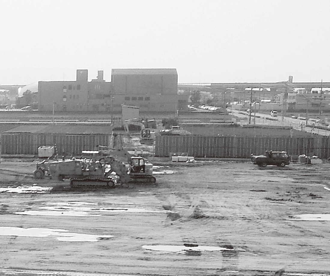
造成工事の始まった、新市民病院建設地