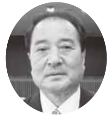
松下 昭憲 議員

問 合併時に、職員の再任用に関する条例が施行された。また、定年退職後の公的年金が支給されず、無収入になる期間が生じ得る、雇用と年金の接続が、課題となっている。