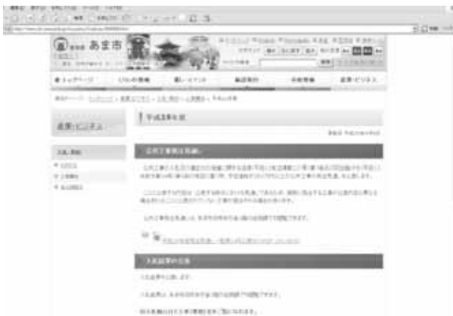
ホームページで公開される、入札結果

※教室内カーストとは 同年年の児童や生徒の間で共有されている「見えない地位の差」を意味する俗語。教室内カーストはいじめにつながるかとされている。