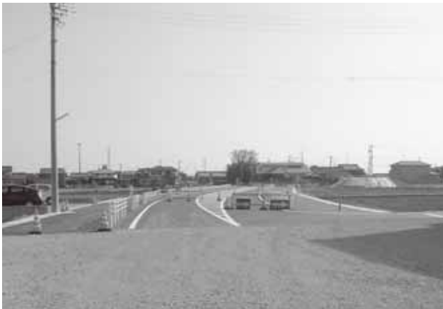
整備が進む安松鷹居線

名古屋市中川区赤星学区（中川区富田町千音寺の名古屋市立赤星小学校を通学区とする地域）などと連携し、要望活動を深めていきたいと考えている。