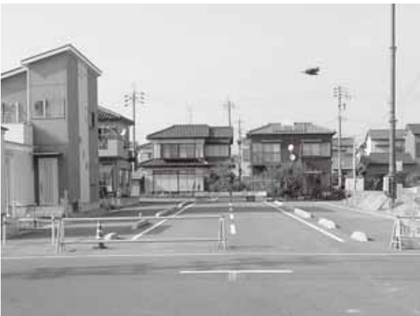
未整備区間の残る美和大治線

建設産業部長 現時点での計画変更は困難と考えるが、具体的な整備手法の住民とともに検討していききたい。 問 木田地域の整備を進めていく間、どのような考えを持っていったのか。 都市計画課長 基本的に美和町の時には土地改良区画整理事業で用地を確保してきた。18軒については、その手法で行えないので、現在は、都市マスタープランにおいて重点施策路線としている。安全、安心で快適に暮らせる活力あるまちづくりを、市民の理解を得ながら整備を進めていきたい。