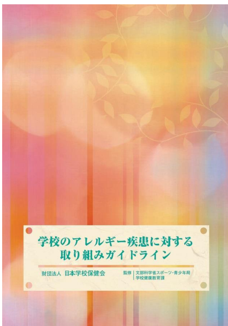
（公財）日本学校保健会「学校のアレルギー疾患に対する取り組みガイドライン」

食物アレルギー対応を必要とする児童生徒（詳細な献立表の配布のみ対応している児童生徒も含む。）は、医師の診断による学校生活管理指導表（アレルギー疾患用）の提出を必須とすることで、対応の必要な児童生徒が限定され、効率的で適切な対応を実現する。