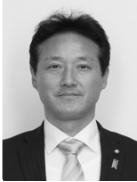
副議長 森 耕治