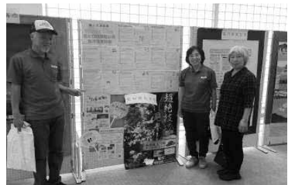
健康都市連合日本支部参加・報告

今後も市で健康の輪を広げていくために、さまざまな活動を計画し実行していきます。皆さんも活き生き推進隊に参加し、自身の元気・知恵・情報を活かしてみませんか。興味のある方は、下記までお問い合わせください。