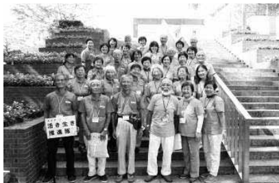
尾張旭市ボランティア交流会