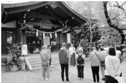
仏閣ウォーキング