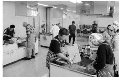
レンジレシピ実習