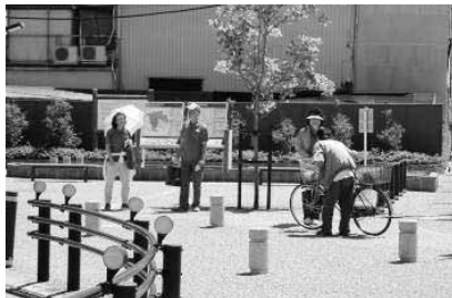
がん検診啓発活動