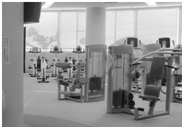
無料が明記されたトレーニング室

平成31年条例第26号により、平成31年4月1日改正・施行済。 介護者1人についての無料が明記された。