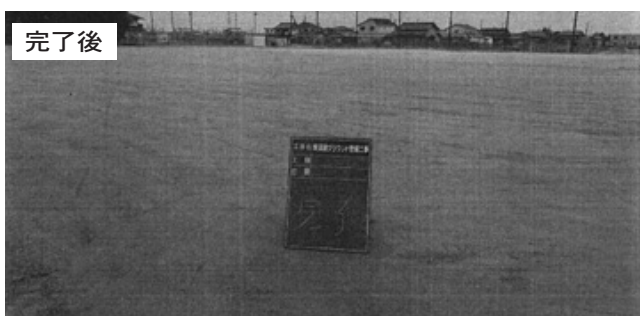
整備工事の終わった蜂須賀グラウンド