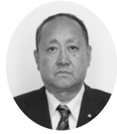
日本共産党 加藤 哲生 議員 (一問一答方式)