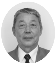
日本共産党 野中 幸夫 議員 (問一答方式)