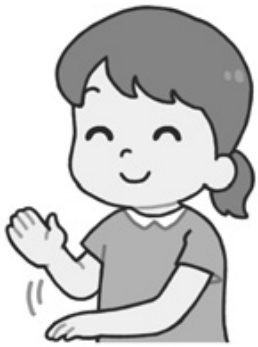
手話で「ありがとう」

他に、「補聴器購入の助成金について」「あま市巡回バスの改善について」「改良住宅について」も質問しました。