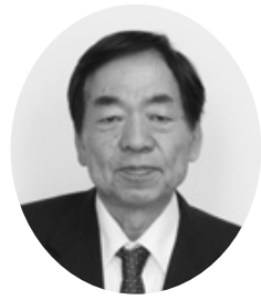
議員 野 俊弘 (二問一答方式) 令和 会 令 野 俊 弘