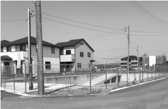
木田郷南土地区画整理事業により整備された調整池

建設産業部長 木田地区排水基本計画の約2万立方分の貯留量を目指す。木田排水機場の遊水池拡張は令和2年度完了予定。河川放流については日光川流域治水対策協議会で調整。治水対策についても同協議会で早期改修整備に向け国・県に要望していく。 市長 住み良いまちづくりのため計画的に推進する。