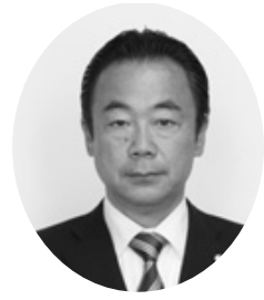
令和 山内 隆久 議員 (一問一答方式)