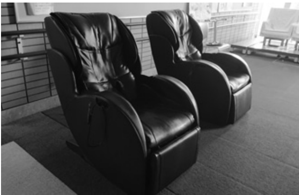
多くの人が利用するマッサージ機

福祉部長 機器購入から10年以上経過し、部品の調達ができず修理ができないものもある。修理費用は、故障箇所や部品もさまざまで、一概にいくらかは難しい。部品調達が可能なものは修繕を行い、部品がない場合は撤去の方