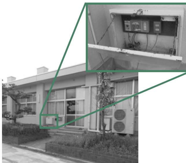
小学校に設置されている屋外コンセント