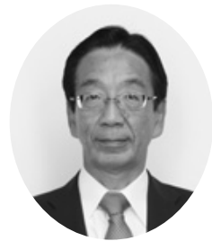
議員 柏原 功 公明党