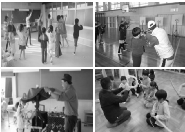
さまざまなプログラムが実施されている放課後子ども教室

熱中症の危険性を回避するため、各小学校の屋外コンセントを使用してスポットクーラーや扇風機を利用できるよう対策を講じた。