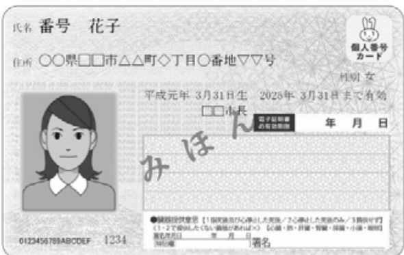
普及が伸び悩むマイナンバーカード

問 ①マイナンバーカード(カード)の申請件数の推移、総取得件数は。②平成31年4月～令和2年1月の各月申請件数は。 市民生活部長 ①申請件数平成27年10月～28年度末8054件、29年度1208件、30年度1059件、31年4月～令和2年1月末1452件、総取得件数9477件。②4月94件、令和元年5月82件、6月91件、7月67件、8月61件、9月146件、10月236件、11月243件、12月171件、2年1