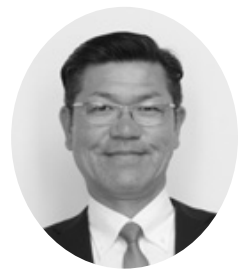
政会 伊藤 嘉規 議員 (一問一答方式)