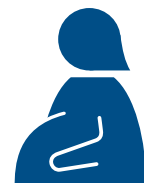
お腹に 赤ちゃんがいる人