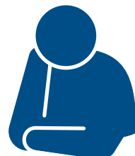
とても 疲れている