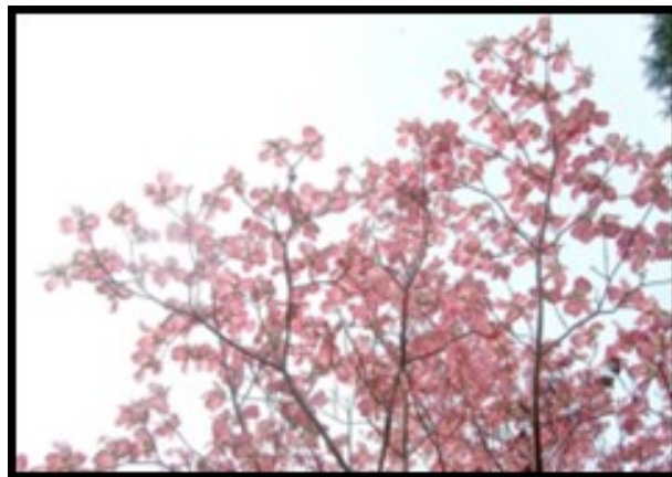
あま市の木 はなみずき