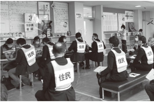
ワクチン接種訓練の様子

市民生活部長 予約の際に七宝・美和・甚目寺保健センター、あま市民病院の4つの会場から希望の会場と日時を選択可能。また、時間は15分単位で選択可能。