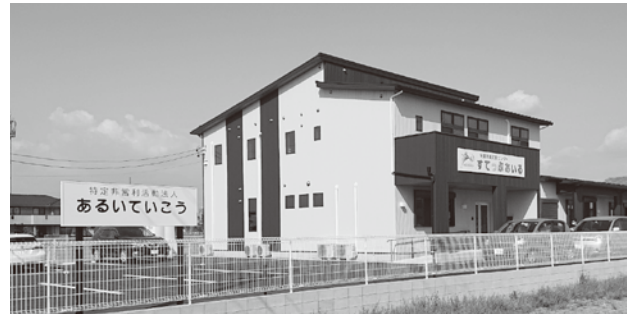
児童発達支援センターが入る予定の建物

福祉部長 認知症高齢者や知的障がい者、精神障がい者が対象。判断能力が不十分で、契約などの法律行為における意思決定が困難な人の生命、身体、自由、財産などの権利を守るため、成年後見制度の利用を促進するとともに、手続き方法などの相談支援を実施。