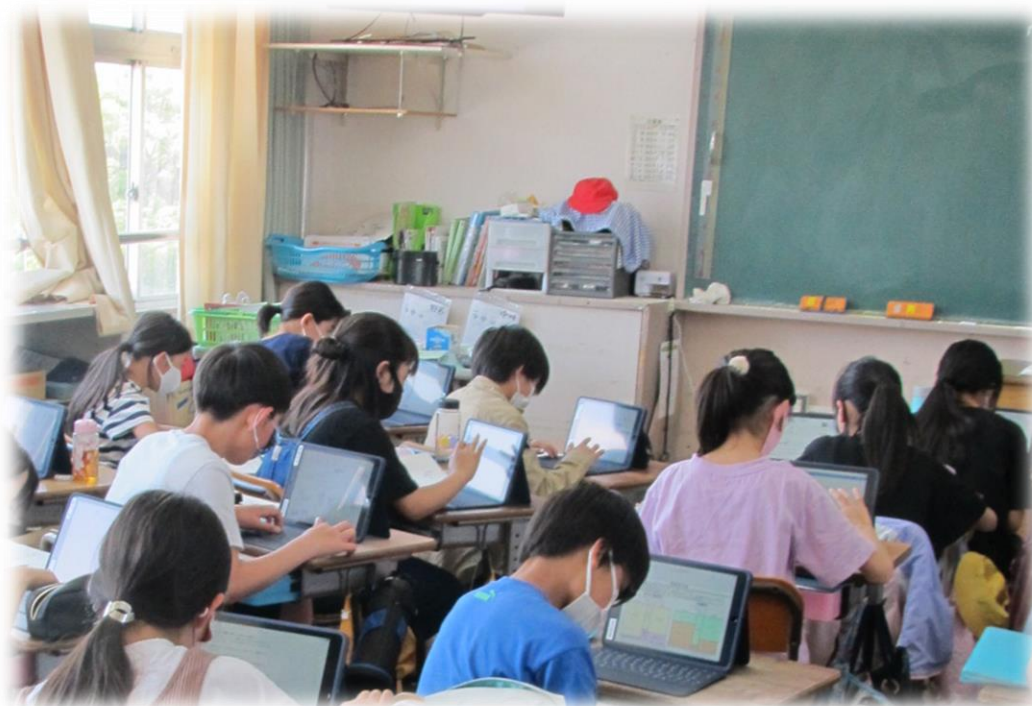
教育 I C T環境を活用した学習