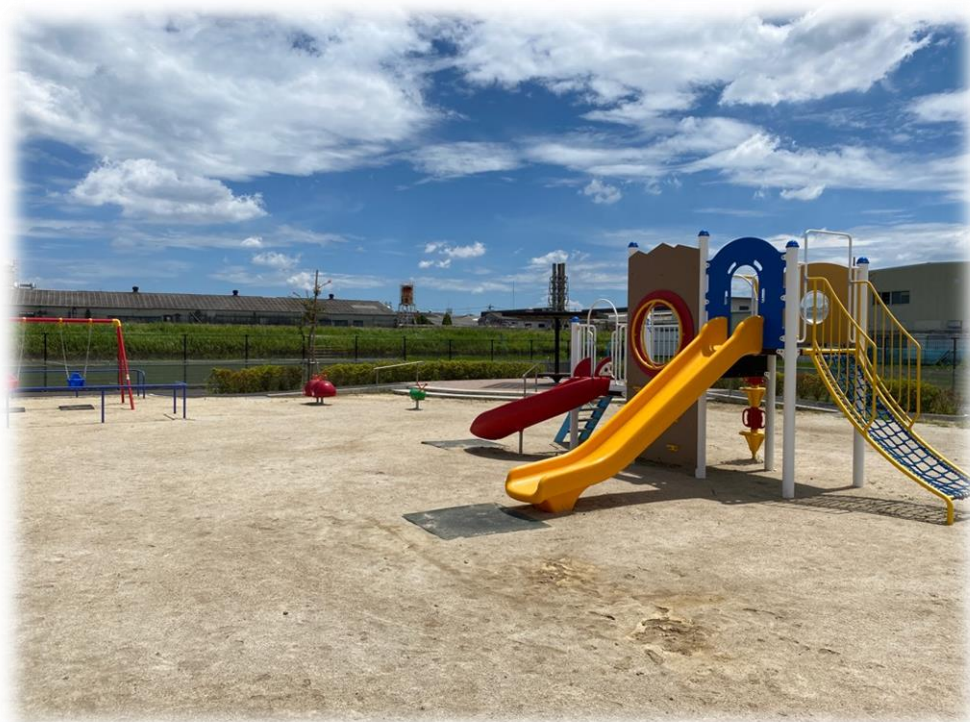
都市公園 スマイルパーク