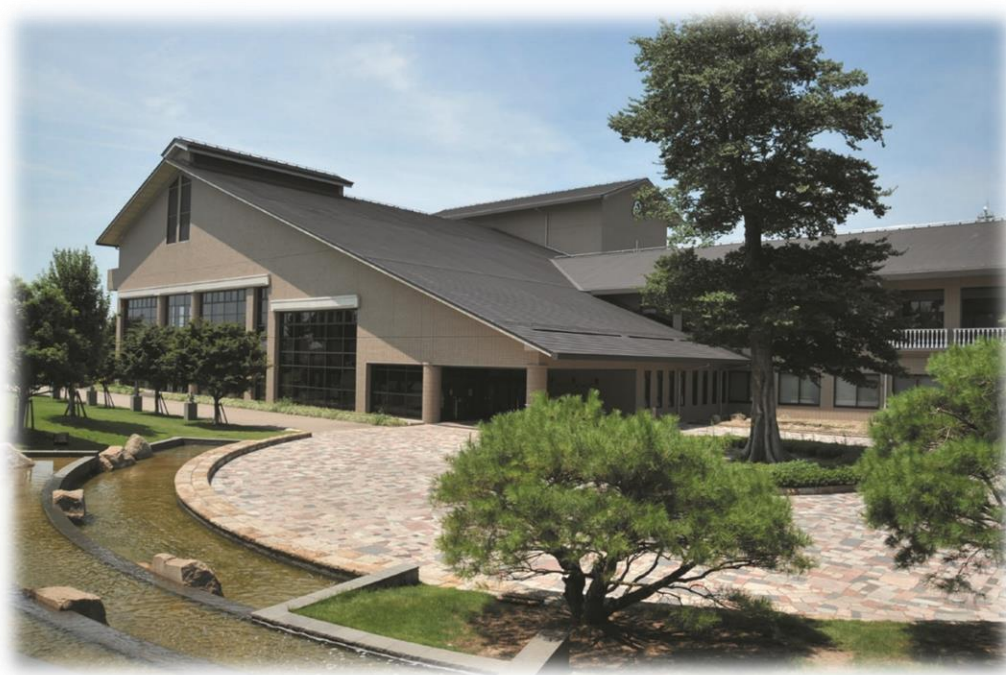
あま市美和文化会館