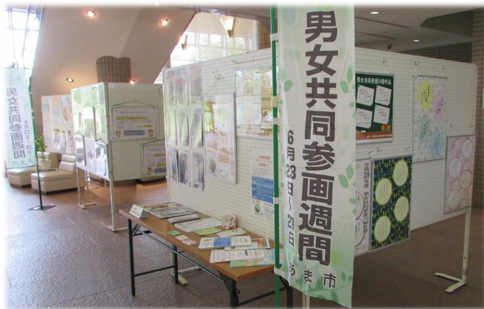
男女共同参画週間パネル展