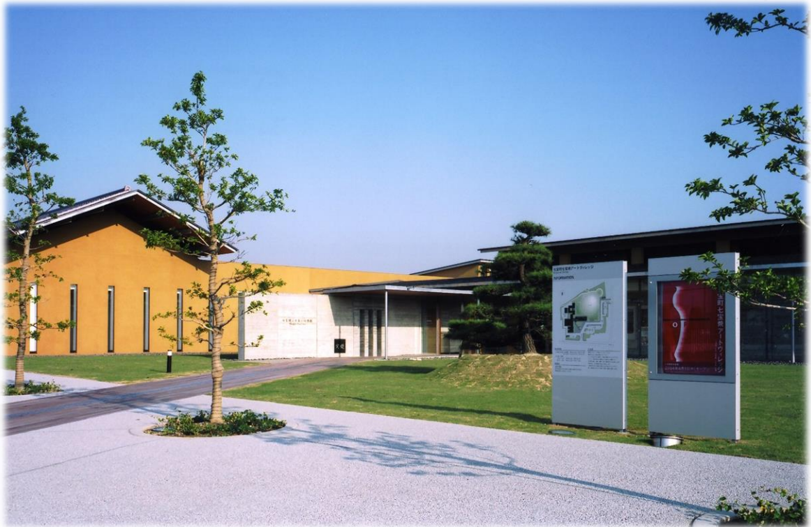
あま市七宝焼アートヴィレッジ