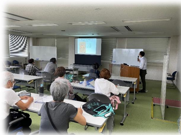
シルバーカレッジ（あま市史跡巡り）