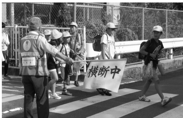
見守り隊の活動の様子

問 さらなる通学路の安全確保のためには市民の協力が必要。市の考えは。 教育部長 警察など関係機関との連携、防犯面でも見守り活動など地域との一層の協力体制づくりが必要。学校でも子どもの発達段階に合わせた交通安全教育を計画的、継続的に実施したい。