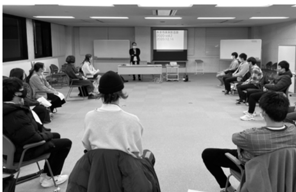
あま発未来創造塾の様子

企画財政部長 企業誘致の推進、創業支援、地域活動の担い手確保を図るため、あま発未来創造塾、定住の促進を図るための大学連携、ファミリーサポートセンターや病児病後児保育などを実施しまちづくりを推進。さらに現在策定中の第2次あま市総合計画におい