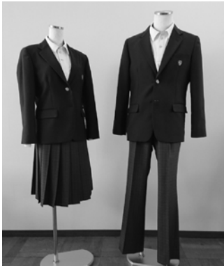
美和中学校に導入されたブレザースタイルの制服

問 GIGAスクール構想について、 ①整備の現況は。②緊急時における家庭でのオンライン学習は。③ICT活用支援への取り組みは。④情報モラル教育は。⑤情報セキュリティ対策は。 教育部長 ①令和2年度末までに全小中学校で、児童生徒と教員に1人1台のタブレット端末、普通教室などに大型モニターと無線LANアクセスポイント、LANケーブルなどを整備。 ②タブレットの家庭への持ち帰りは当面行えない。今後はルーターの貸し出し、通信料の負担などを検討し、緊急時に限り実現できるように進めていく。 ③教員に、令和3年度は6回研修を実施、令和4年度以降は年2回実施予定。 ④発達段階に応じて道徳や総合学習の中で、児童生徒が情報モラルの大切さを考え、理解できるように計画的に進めていく。