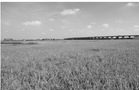
企業誘致を進める方領地区