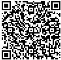
あまスポーツクラブについては上記 QR コードから