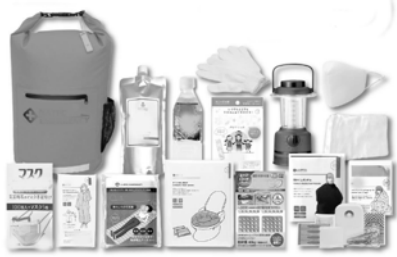
好評を得ている返礼品の防災セット

問 防災セットの内容は。 総務課長 防災セットは、1人用、2人用、女性用、車載用など6種類あり、光るホイッスル、耐震性ジェルマット、マスク、携帯トイレ、目隠しポンチョ、軍手、アルコール消毒シート、ファーストエイドセット、レインコート、エマーゼンシート、防災用エアマット、携帯用ランタン、5年保存水など。