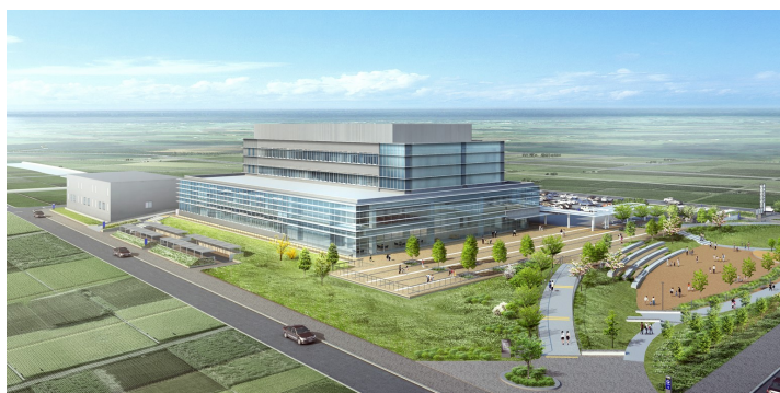
令和 5 年 5 月新庁舎開庁