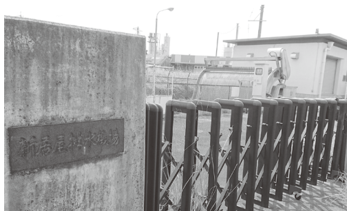
移設予定の甚目寺第1排水機場

「子どもの未来応援のために」と使途を特定した寄付でICTを活用した学習活動の充実を図る、小中学校ICT化推進事業費100万円。