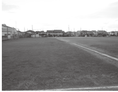
使用料が新設された森グラウンド

ゲートボール場の使用料を新設し、既に廃止している甚目寺総合体育館内のサウナ室に係る規定を削るものです。