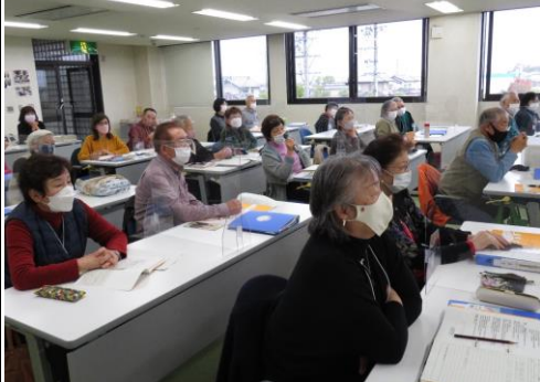
相続税はむずかしい…