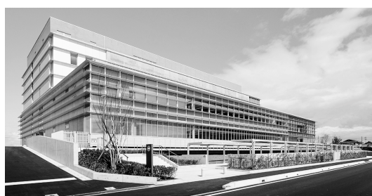
▲防災拠点となる新庁舎