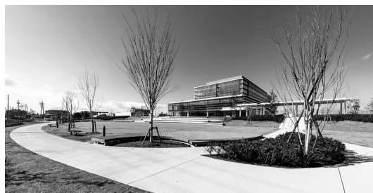
▲東側広場スペース