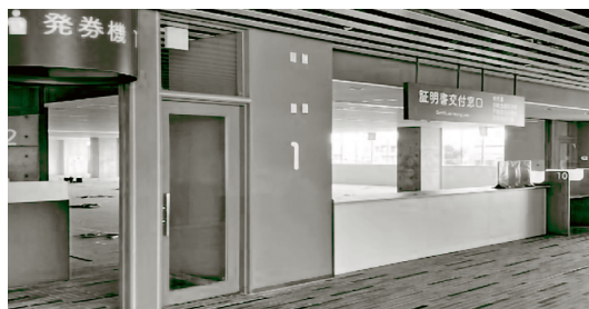
▲新たに設置する証明書交付窓口