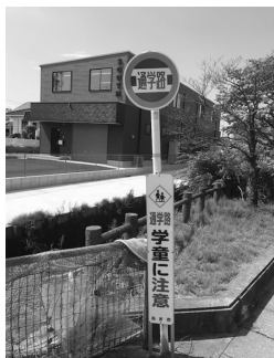
更新された通学路標識

残りの箇所については、令和4年度にグリーンベルトや横断歩道の設置を実施し、対策を進めていく予定。