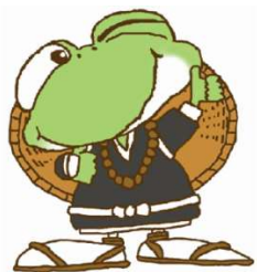
あま市公認キャラクター あまえん坊