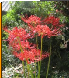
影も頑張って歩く!