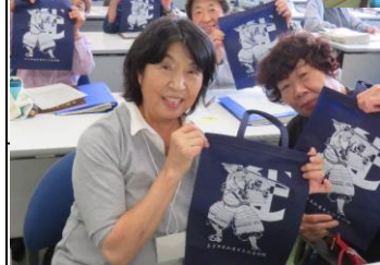
街歩きクイズ優勝 1班