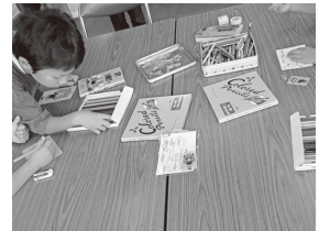
父の日のプレゼント作り