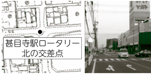
甚目寺駅ロータリー北の交差点

北から進入し、左折した時、歩行者を巻き込みそつになった。この交差点には3か所に横断歩道があるが、この歩行者が横断しようとした場所には横断歩道がない。もともと交通量の多い交差点。朝夕は買い物客や駅の利用者で混雑し、急ブレーキの音がよく聞こえるという。規則の順守と譲り合いが必要だ。(市公式ウェブサイトに掲載ヒヤリハット・あ！マップから抜粋)