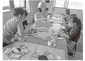
七夕飾りを作ろう

●児童館まつり(満3歳～未就学児親子小学生) 8月8日(火) 2部制(各定員30人) ①午前9時15分～10時15分 ②午前10時45分～11時45分