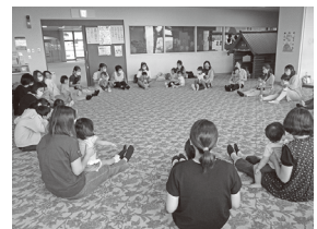
ちびっこあつまれ(音楽あそび)