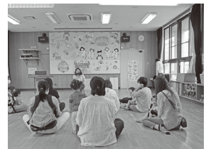
ちびっこあつまれ(おはなしなあに)