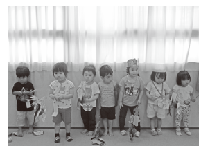
コアラ教室「七夕飾り」