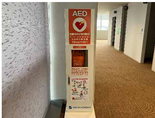
市役所に設置されるAED（自動体外式除細動器）

問 コンビニにAEDを設置することは。 市長公室長 コンビニのAEDの設置は、24時間使用できることや設備環境が整っていることから設置場所として最適であると考えている。先進自治体などの事例を参考に、設置に向けて費用面を含めた協定締結の方法について調査研究をしていく。