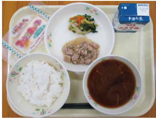
5月に提供されたオーガニック食材の給食

にする目標だが、本市は。 建設産業部長 技術支援や情報収集・提供などの取り組みを調査研究する。