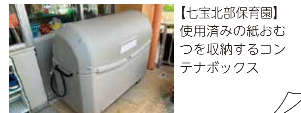
【七宝北部保育園】使用済みの紙おもむつを収納するコンテナボックス

保護者が使用済み紙おもむつを持ち帰ることの負担解消、園児別に使用済み紙おもむつを分別する保育士の負担解消を目的に、令和4年12月より保育園などにおいて使用済み紙おもむつの回収・処分を行っている。 なお、私立認定こども園などについては、実績に応じて補助金を交付している。