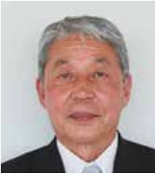
日本共産党 野中 幸夫 議員 一問一答方式