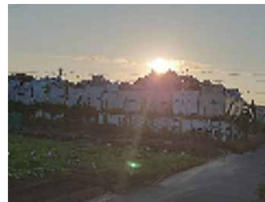
一般質問において問題提起された市内の場所（写真加工）

問 市内にゴミが山積みにしてある所があるが、確認しているか。 市民生活部長 資源とゴミが混ざり合っているものが山積みにしてある場所については確認している。 問 丹波区内にゴミが山積みにしてあり、半年前に市と県に連絡し、行政指導してもらったが、何の変化もない。その後の進捗状況は。 市民生活部長 ほとんどが産業廃棄物とみられ、所管の県海部県民事務所環境保全課と情報を共有。県は関係法令などに基づき事実確認し、行為者などに対し今後の取り組みに関する計画書の提出などの行政指導に当たっている。 問 提出までに必要な期間は。また、その間見守るだけで近隣住民が我慢するだけなのか。 市民生活部長 期間については地主な