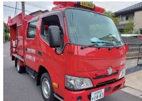
令和4年度に配備した消防団積載車

消防団が使用する小型動力ポンプ付き積載車のうち、購入から20年を超える2台を更新する。