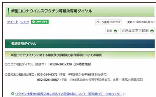
【あま市ウェブサイト】 新型コロナウイルスワクチン等相談専用ダイヤル

健康状態調査は行われたか。 子ども健康部長 実施している。 問 HPV(子宮頸がん)ワクチンについて、HPVワクチンによるベネフィットとリスクを市ではどのような方法で周知を行っているか。 子ども健康部長 個別通知にHPVワクチンのリーフレットを同封しており、ベネフィットとしては、子宮頸がんの発症や死亡の減少が期待できること、リスクとしては、注射部位の疼痛など局所反応や軽度の発熱、倦怠感などの副反応、重い副反応としてアナフィラキシーについて記載している。