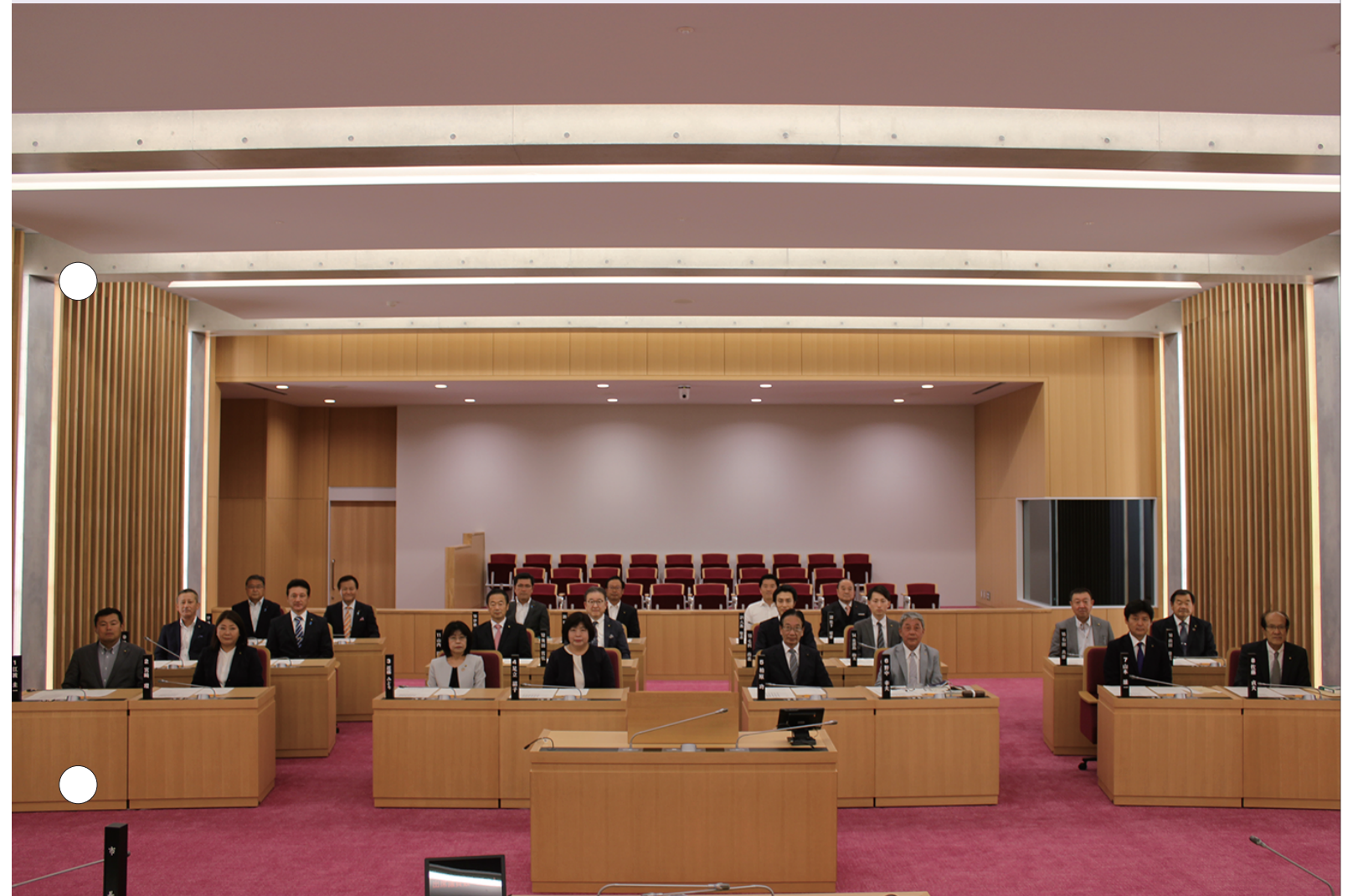
初議会 (5月19日 あま市役所 新議場にて)