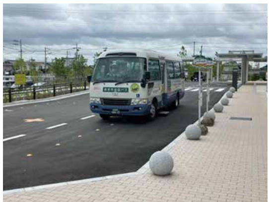
巡回バス（あま市役所）

び市民病院無料送迎バスなどによる公共交通機関などが運行しており、巡回バスにより市内をおおむね網羅している。移動困難者の実態のデータがないため、今後は実態の把握に努め、より良い地域の交通ネットワークの充実と協調ができるよう努めていく。