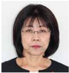
公明党 近藤 みどり 議員 一問一答方式