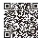
国税庁 公式LINEアカウント