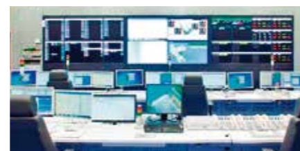
現在の海部地方消防指令センターの様子 (海部地方消防通信指令事務協議会)

問 消防救急デジタル無線基本調査業務の内容は。 市長公室長 海部地方消防指令センター、名古屋市消防局防災指令センターなどと共同整備する消防救急デジタル無線の更新に係る現地調査、簡易電波伝搬調査などを実施する。