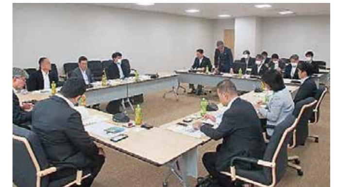
10月31日門真市議会総務建設常任委員会