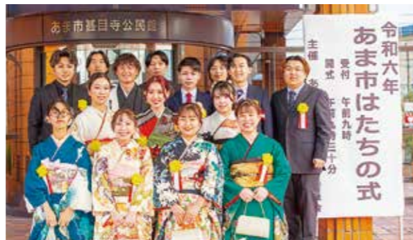
甚目寺地区はたちの式実行委員