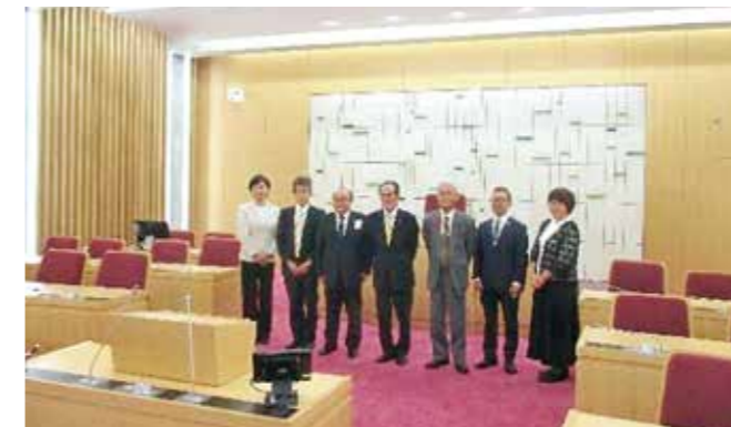
10月4日亀山市議会議会運営委員会