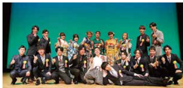
七宝・美和地区はたちの式実行委員

「あま市には色がない」この言葉が市民の心に根付いていないのでしょうか。あま市で生活していると、色で季節を感じる機会がありません。市の花である、ゆりを皆で道沿いに植える活動を展開し、この現状を変えませんか。色彩豊かな花々はこの街を美しく彩り、訪れる人々に心地よい空間を提供します。あなたが育てた花が今日も誰かを幸せにしている、これほど誇れることがあるのでしょうか。共にこの広大なキャンパスにあま市という絵を描きませんか。