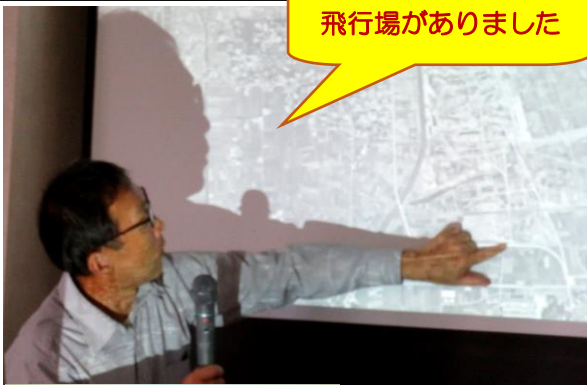
飛行場がありました

十月八日(火)は、あま市歴史民俗資料館館長により、「あま市をもっと好きになる！」というテーマで、あま市の歴史や文化について学びました。長年あま市に住んでいても、知らないことがたくさんあって、皆さん授業に興味津々でした。 今回の授業をきっかけとして、あま市の歴史や文化が、ご家庭や地域でのコミュニケーションツールの一つになるといいですね。