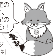
不動産登記推進イメージキャラクター「トウキツネ」