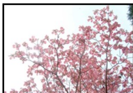
あま市の木 はなみずき